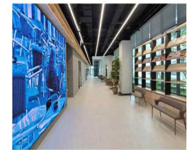
1층 서가형 로비